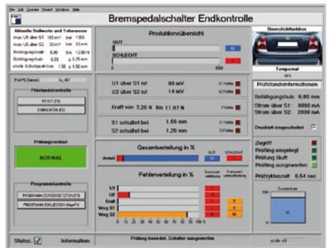
BEISPIEL EINER BEDIENOBERFLÄCHE