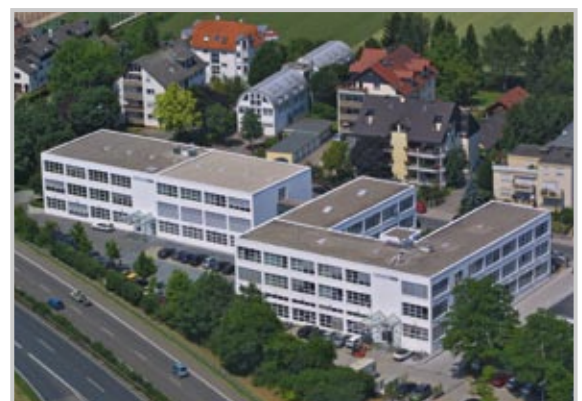
ECKELMANN AG, Wiesbaden