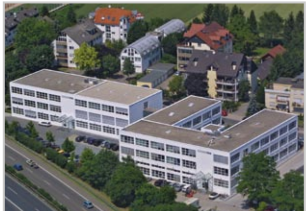
ECKELMANN AG, Wiesbaden