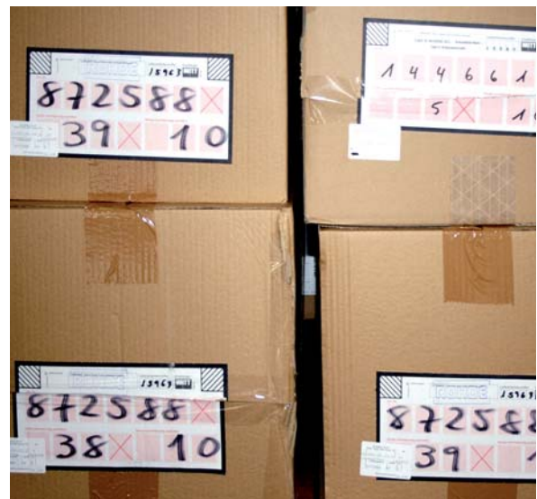
Kartons aus verschiedenen Kulturkreisen liefern unterschiedliche Beschriftungen.