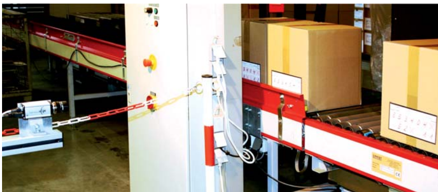
Die Aufnahme der Bilder der Kartonbeschriftungen erfolgt vor einem schwarzen Hintergrund (ganz rechts).

den und eine nachhaltig zuverlässige und servicefreundliche Lösung entstehen. Eine Evaluierung ergab, dass die am Markt angebotenen Standard-Lösungen zur Paketidentifikation durch OCR sich als zu umfangreich erwiesen und nicht unmittelbar kompatibel zur bestehenden Automations- und IT-Landschaft waren. Deshalb entschied sich Witt Weiden daher für das Angebot von Eckelmann, die die Entwicklung einer passgenauen und individuellen Lösung ausschließlich für die optische Handschriftenerkennung angeboten hatte.