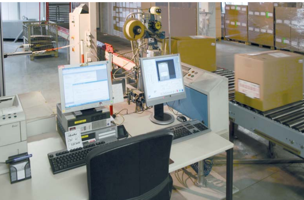
Bild der Gesamtanlage. Im Vordergrund ein Standard-PC, rechts die Bedienmaske zur Bildverarbeitung, dahinter die Etikettierer. In der Bildmitte im Hintergrund der Schaltschrank mit der SP55, ganz links im Bild eine µEye-Kamera.

Mit dem Austausch des Bildverarbeitungssystems sollte die Performance – also die Leserate der Identifikation – gesteigert wer-