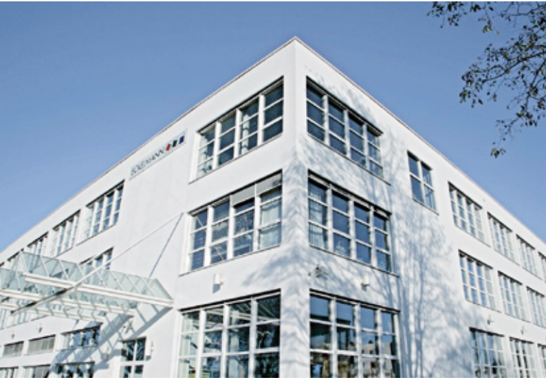
Sitz der Eckelmann AG, Wiesbaden